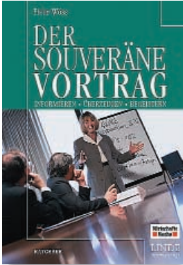
€ 24,90 (D)/€ 25,60 (A)/sFr 44,80